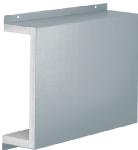
Schiebemuffe FWK 30/3E I90/E30 50x210 vz