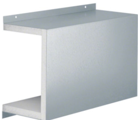
Manchon coulissant, FWK 30/99160, galvan.