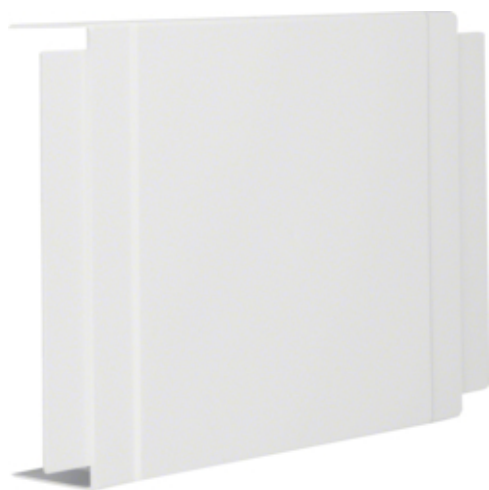
T-Stück halogenfrei LF/FB 60x230mm cweiß