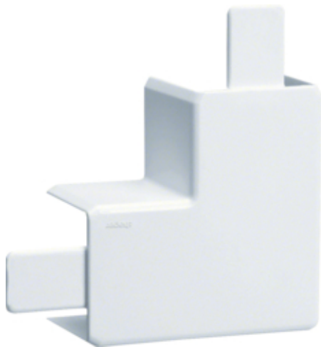
Angle plat, LF 20035/36, blanc paloma