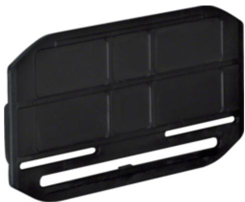
Kupplung halogenfrei zu LF/LFH Höhe 60mm