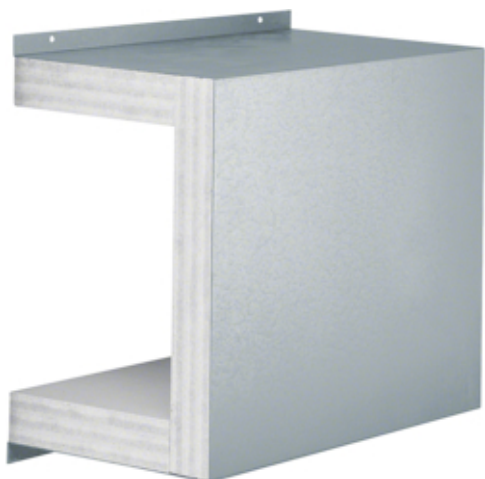
Manchon coulissant, FWK 90/99160, galvan