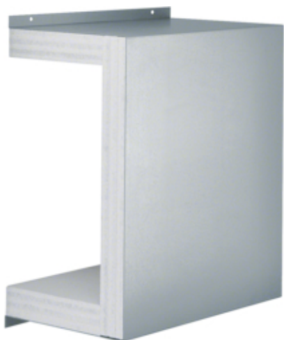
Schiebemuffe FWK 90 E90/E30 100x260mm vz