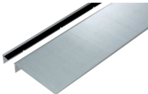
Couvercle avec brosse pour goulotte sol, BKB25085