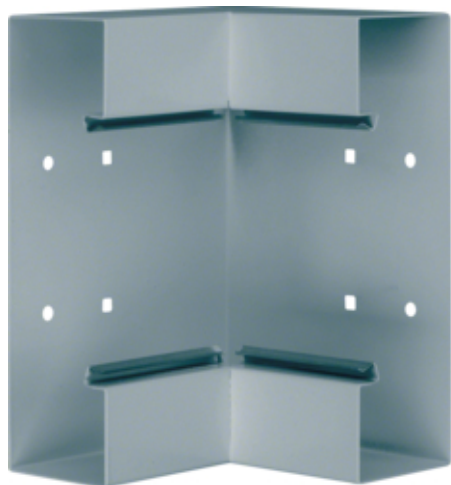
Inneneck aus Grundprofil zu BRS 68x210mm Oberteil 120mm aus Stahlblech verzinkt