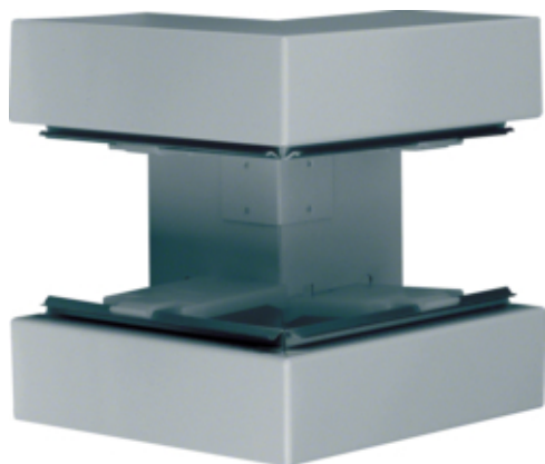
Außeneck Grundprofil BRS 85x170 OT 80 vz