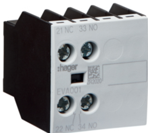
Bloc de contacts auxiliaires 1NO+1NC pour EV007-38, EVN022-45