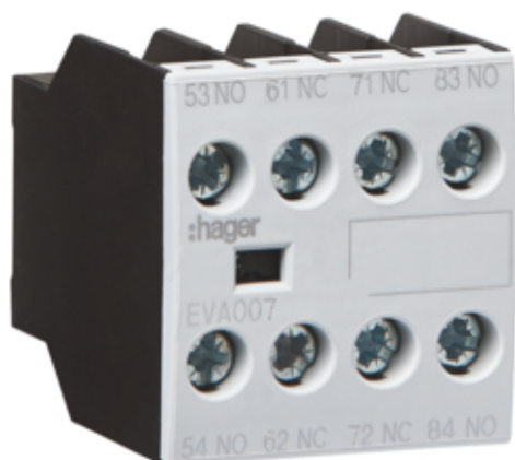
Bloc de contacts auxiliaires 2NO+2NC pour EV007-38, EVN022-45