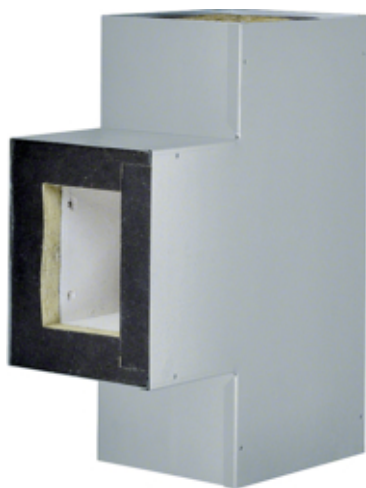
Té, FWK 90/99160, galvanisé