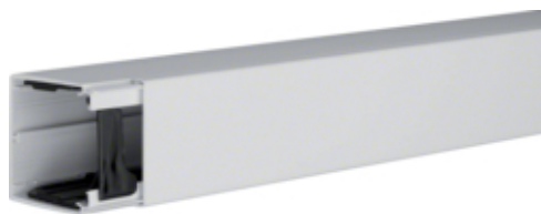
Goulotte 60060, gris clair