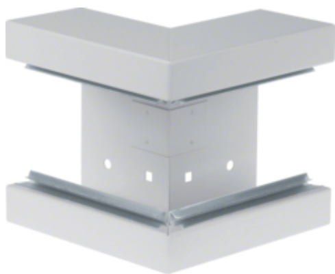
Angle extérieur, acier